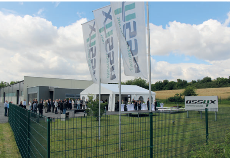
Der Einladung zum Firmenjubiläum im Juli folgten zahlreiche Kunden und Interessenten aus dem In- und Ausland.

Kunststoffummantelte Bauteile sind der Stoff, aus dem die Erfolgsgeschichte der Assyx GmbH & Co. KG entstand. Zehn Jahre sind seit der Gründung des in Andernach-Miesenheim ansässigen Unternehmens vergangen. Mittlerweile hat sich der Hersteller des Assyx DuroBoard®, eine hochwertige Unterlagsplatte, die bei der Herstellung von Betonprodukten zum Einsatz kommt, als eines der weltweit führenden Unternehmen seiner Branche etablieren können.