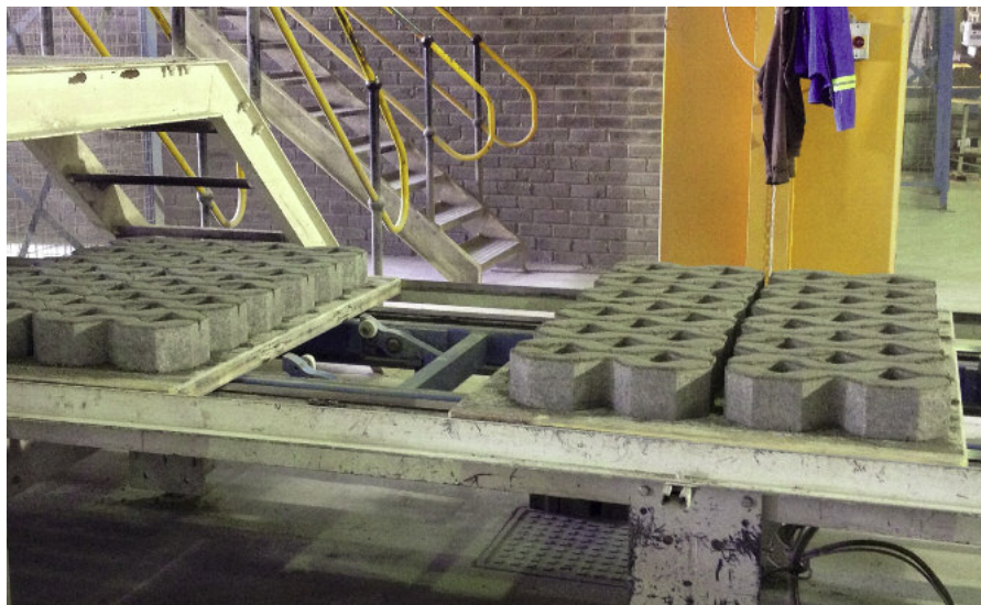
DuroBoards firmy Assyx wykorzystywane w produkcji drobnowymiarowych elementów prefabrykowanych w Bosun.

We wrześniu 2013 r. Assyx wystawiał się na baumie odbywającej się po raz pierwszy w Afryce w Midrand koło Johannesburga w Republice Południowej Afryki. Assyx działa na rynku afrykańskim już od 2007 r. Firma Bosun Brick z Midrand, oddalonego o zaledwie dziesięć minut od terenów targowych, była pierwszym klientem firmy Assyx w połowie roku 2007.